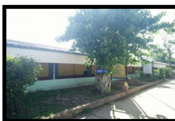
อาคารเรียน อาคารเรียน ชั่วคราวปฏิรูป การศึกษา ปีที่สร้าง 2540

ตารางที่ 3 แสดงข้อมูลสิ่งก่อสร้าง โรงเรียนวังข้าพัฒนา สังกัดสำนักงานเขตพื้นที่การศึกษามัธยมศึกษา สุรินทร์