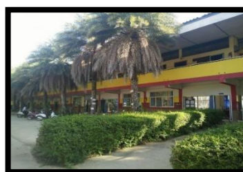
อาคารเรียน 108 ล,108 ,ล/ 30,108 หรือ108 ชื่อ อื่นๆ ปีที่สร้าง 2548